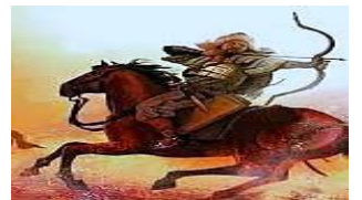
Hun Atlı Okçuları