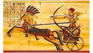
Eski Çağ'da Ordu

SORU 10: (ÇIKTI/Kazanım: TAR.9.2.2.): Yandaki görselden hareketle Hun Türklerinde ordu ile ilgili neler söylenebilir? (10 puan)