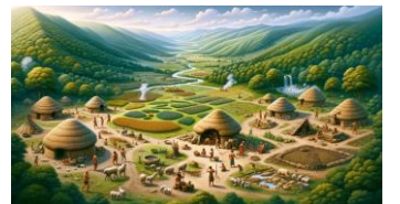
Tarım Devrimi ve Yerleşme

SORU 5: (ÇIKTI/Kazanım: TAR.9.2.1.): Yandaki görselden hareketle Tarım Devrimi'nin yerleşmeye etkilerini yazınız. (10 puan)