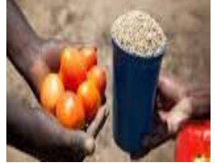
Üretici Toplum- Artı Ürün

SORU 7: (ÇIKTI/Kazanım: TAR.9.2.2.): Yandaki bilgi kutusundan da yararlanarak Eski Çağ'da yönetimler hakkında bilgi veriniz. (10 puan)