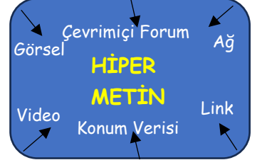
Zenginleştirilmiş Sunum Taktiği: Hiper Metin

SORU 2: (ÇIKTI/Kazanım: TAR.9.1.4.): Yandaki görseli de dikkate alarak "Hiper Metin" kavramını açıklayınız ve hiper metin örneği veriniz. (10 puan)